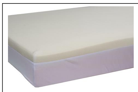
een tricothoes rond de kern vangt de interne schuifkracht op