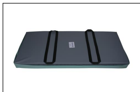
anti-slip onderzijde & handvaten